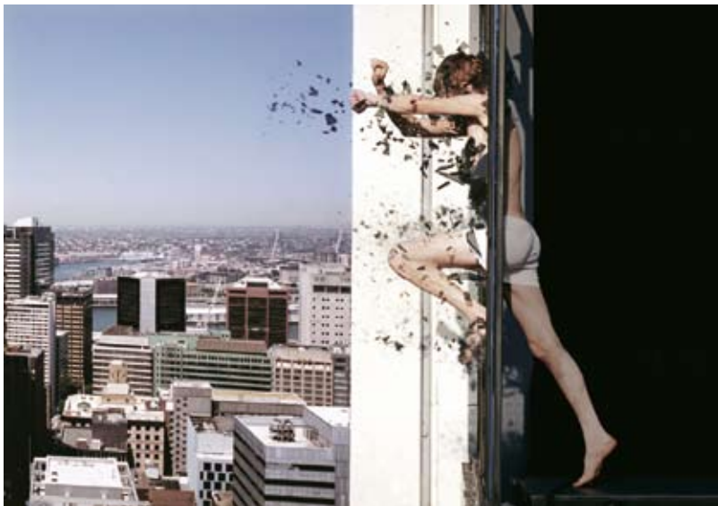
Daniel Askill, 'Suspending Disbelief', 2008, vidéo.