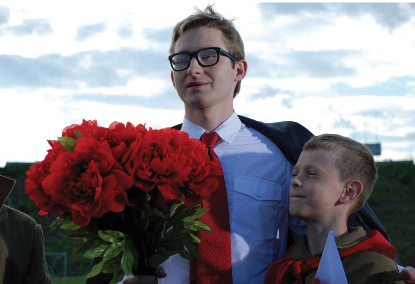
Yael Bartana , 'Mary Koszmary', 2007, 10 min 50, film super 16 mm transposé sur dvd, pal, couleur, sonore, 16:9. Courtesy Annet Gelink Gallery, Amsterdam / Foksal Gallery Foundation, Varsovie. FRIEZE.