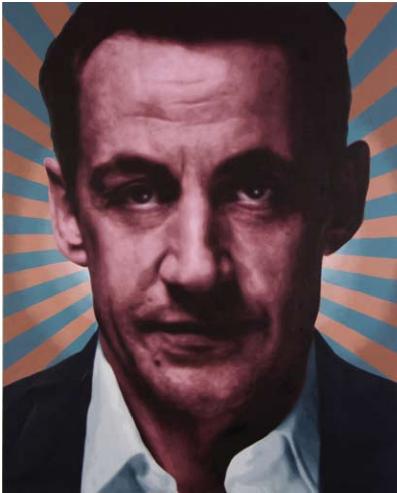
Yan Lei, 'Sarkozy'.