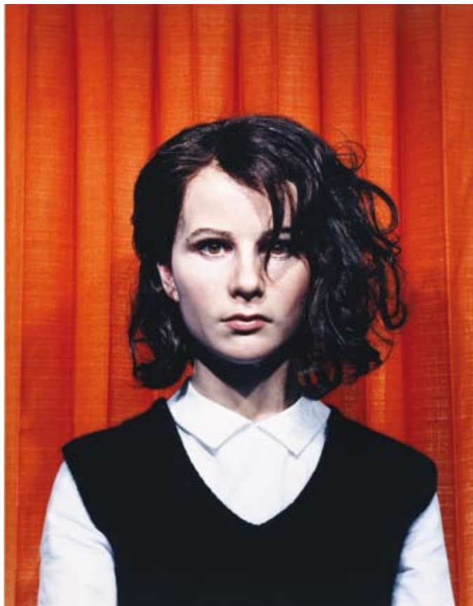
Gillian Wearing , 'Self Portrait at 17 Years Old', 2003, c-type print, 115,5 x 92 cm. Courtesy Maureen Payley, Londres. FRIEZE.

Frieze Art Fair , du 16 au 19 octobre, Regent's Park, Londres, www.friezeart-fair.com ; SoFF , du 15 au 19 octobre, The Village Underground, www.soff.fr ; avec Eurostar : www.eurostar.com . FIAC , du 23 au 26 octobre, Grand Palais, Cour Carrée et Jardins des Tuileries, Paris, www.fiac.com ; Show Off , du 22 au 26 octobre, Espace Pierre Cardin, Paris ; Slick , du 24 au 27 octobre, Centquatre, Paris, www.slick-paris.com ; avec Thalys : www.thalys.com