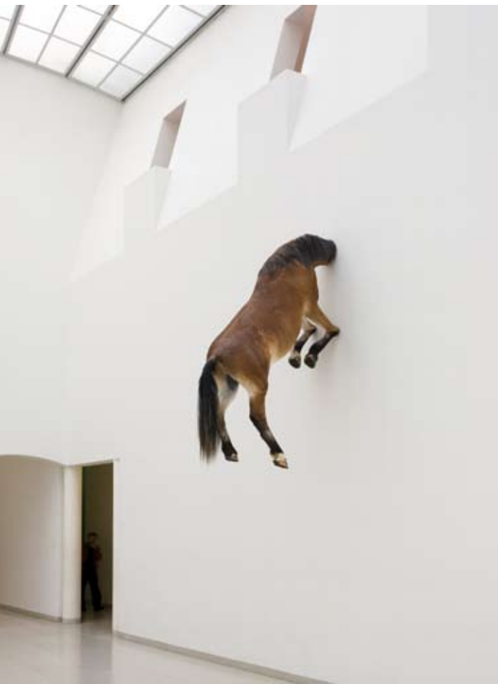
Maurizio Cattelan , "Untitled", 2007, cheval naturalisé, taille réelle.