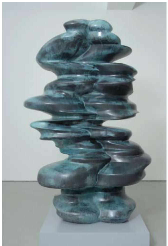
Tony Cragg , 'Ugly Faces', 2007, © Tony Cragg. FIAC.