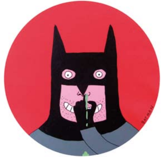
Laurina Paperina, 'Batman', 2008, peinture sur bois, 24 x 24 cm.