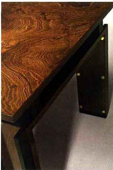
André Sornay, table, 1936, acajou massif et clouté, 75 x 225 x 90 cm sans allonges, détail (galerie Alain Marcelpoil, Paris).

L'alliance entre l'art contemporain et le design semble irrésistible depuis quelques années.