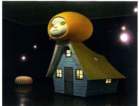
Yoshitomo Nara, Voyage of the moon/resting moon , 2006, installation au 21 st Century Contemporary Museum of Art de Kanazawa, 476 x 354 x 495 cm (galerie Meyer & Kainer, Vienne).